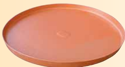
Galleggiante ad olio