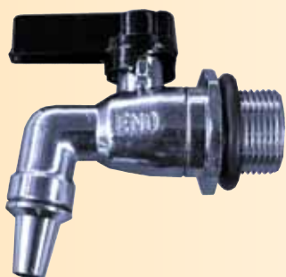
Rubinetto 3/4" INOX