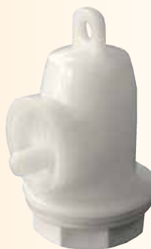
Valvola a doppio effetto in PE